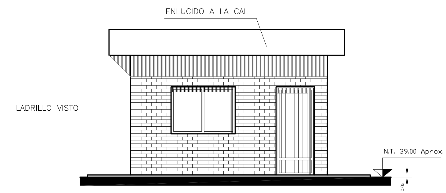
VISTA 1 ESC.:1:50